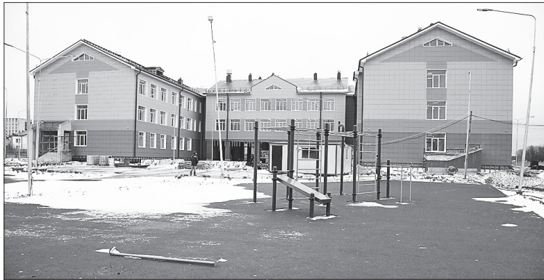
■ Подобная школа уже построена в Архангельске и вскоре примет детей огромного и бурно развивающегося района

– В рамках концессионного соглашения планируется возвести общеобразовательную школу на 860 мест в округе Майская Горка Архангельска – в районе улицы Ленина, – сообщил министр образова-