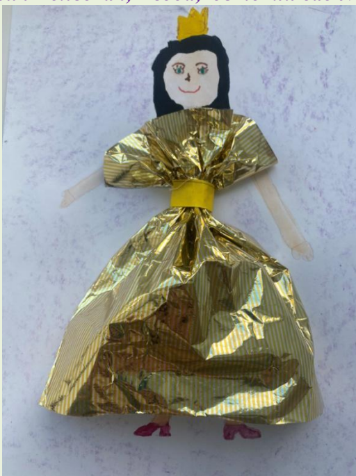
"Наряд для мамы"

Ярослав Зинченко, 6 лет, детский сад № 159