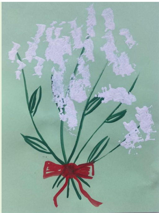
"Букет для мамы"

Анисия Вольская, 2 года, детский сад № 159