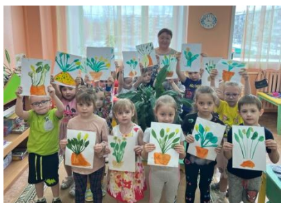
дети группы "Золушка" детского сада № 123 "АБВГДейка"

А вы знали, что комнатные растения могут стать настоящими друзьями детей? Растения – это маленькая зеленая лаборатория, где ребенок знакомится с природой и приобретает много полезных знаний.