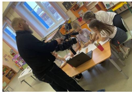
дети группы "Семицветики", детского сада № 11 "Полянка"

13 марта в издательском доме "ПОЛЯНКА" проводилась съемка ВГТРК "Вести Поморья" о подготовке выпуска городской газеты "Медиаграмотный Я".