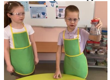
дети группы "Семицветики", детского сада № 11 "Полянка"