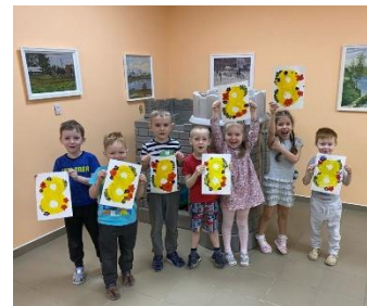
Дети детского сада № 121 "Золушка"

Воспитанники детских садов города Архангельска вместе с воспитателями и музыкальными руководителями постарались порадовать милых дам, одаривая их комплиментами и самыми нежными словами.