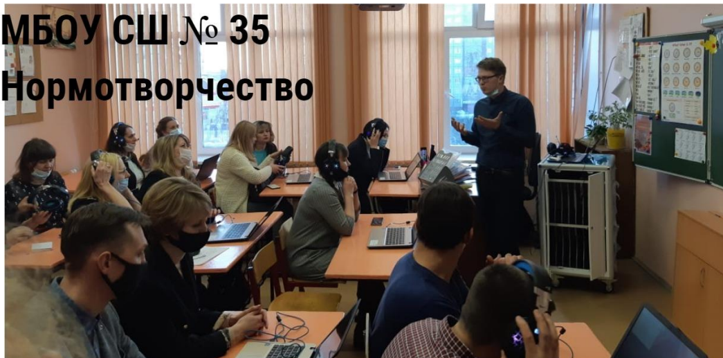
МБОУ СШ № 35 Нормотворчество